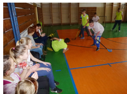
Florbalové "bitky" medzi triedami