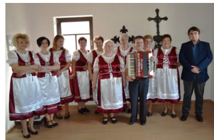
15. výročie založenia Hámorčanky