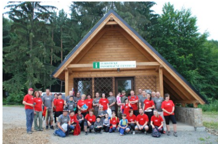
Otvorenie Turistického informačného centra v júni 2015