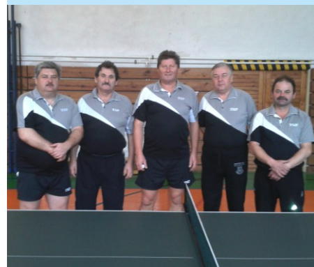
ŠKST Zemplínske Hámre

pokračovanie zo str. 1: Ďakujem Farskej rade a pánovi farárovi za spoluprácu a ústretovosť; ďakujem našim športovcom – stolným tenistom a futbalistom za úspešnú reprezentáciu našej obce; podnikateľom, ktorí podporili akcie obce; zamestnancom obecného úradu a všetkým tým, ktorí sa podieľali na činnosti našej obce. V neposlednom rade ďakujem aj poslancom obecného zastupiteľstva. Do nového roka Vám chcem zaželať všetko len to najlepšie, veľa zdravia, šťastia, lásky, radosť v kruhu blízkych a v kruhu rodinnom. Nech je každý deň nového roka pre Hámorčanov lepší, ako ten predošlý.