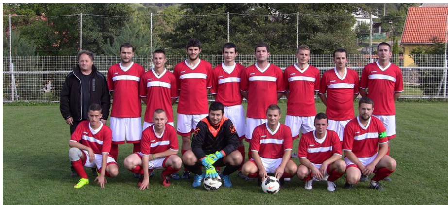
TJ Vihorlat Zemplínske Hámre