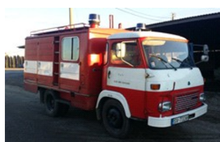
hasičské vozidlo Avia A30