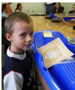
Európsky deň čísla 112 v MŠ